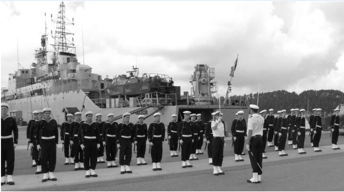
Träning på Muskö.