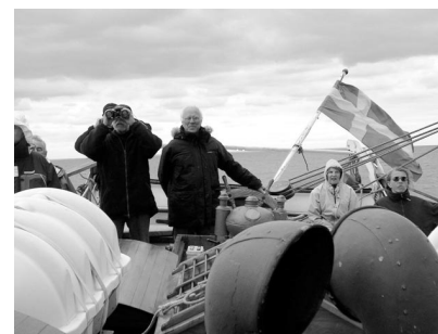
Författaren till rors.

Bestyckningen har varierat under årens lopp alltifrån de ursprungliga långsamma 28 cm kanonerna till ett modernare och lättare artilleri, riktat så att man hade kontroll över Öresund från Hven i norr, Malmö(!) i öster och Drogden i söder. Under andra världskriget besatte tyskarna fortet och dom lär ha glömt en soldat när de drog sig tillbaka. Han hette Helmuth och spökar nu i de mörka gångarna.