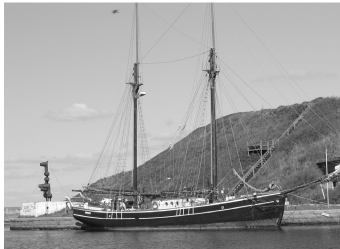
Helene förtöjd vid Flakfortet.

Vi satte kurs nordväst direkt på Flakfortet. Inga varningsskott hördes, så vi gick in i hamnen, förtöjde och rusade iland utan att möta något motstånd. Ön