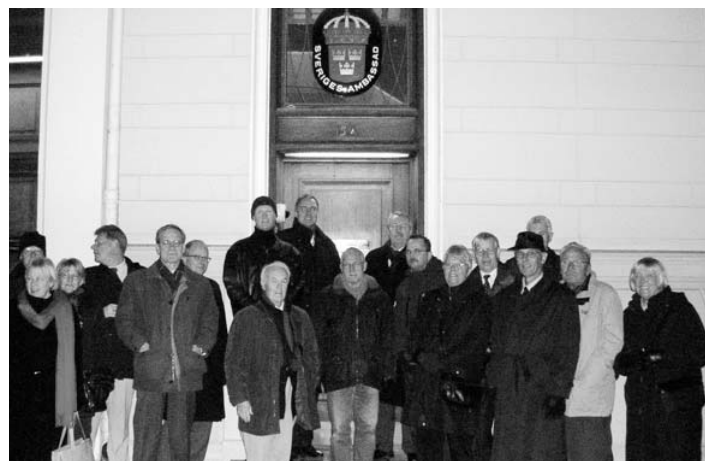
Förväntansfulla skåningar utanför Svenska Ambassaden